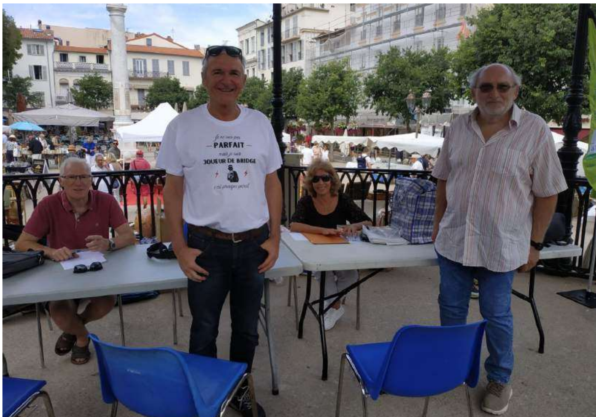
L'accueil des participants