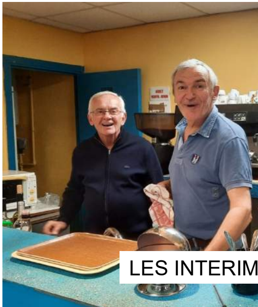
LES INTERIMAIRES DU BAR